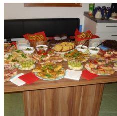
Nachlese 1. SEB-Sitzung 2014